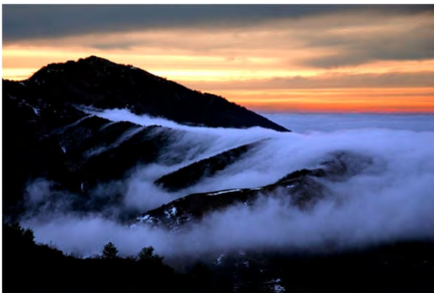
Il sale passava anche dalla colla di Prale

Gli abitanti di Montegrosso, Mendatica, Cosio e Pornas-