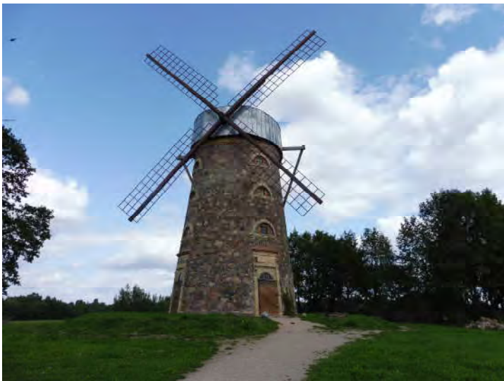
Mulino a vento a Pakruoyis (Lituania settentrionale)

non più in uso, sembrano sentinelle intente a sorvegliare la campagna che si risveglia, o dei numerosi mulini ad acqua, in alcuni casi ancora funzionanti con le attrezzature originali di un tempo, quand'erano indispensabili per la popolazione.