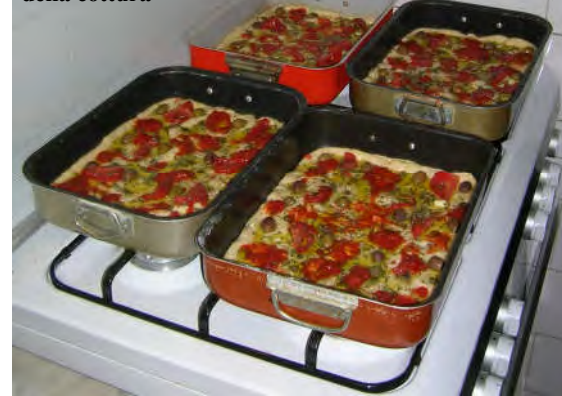
Le 4 sardenàie prima della cottura

tura, infornare e cuocere a 180° per circa mezz'ora o poco più. Non c'è bisogno, naturalmente, di augurare buon appetito. (G.G.)