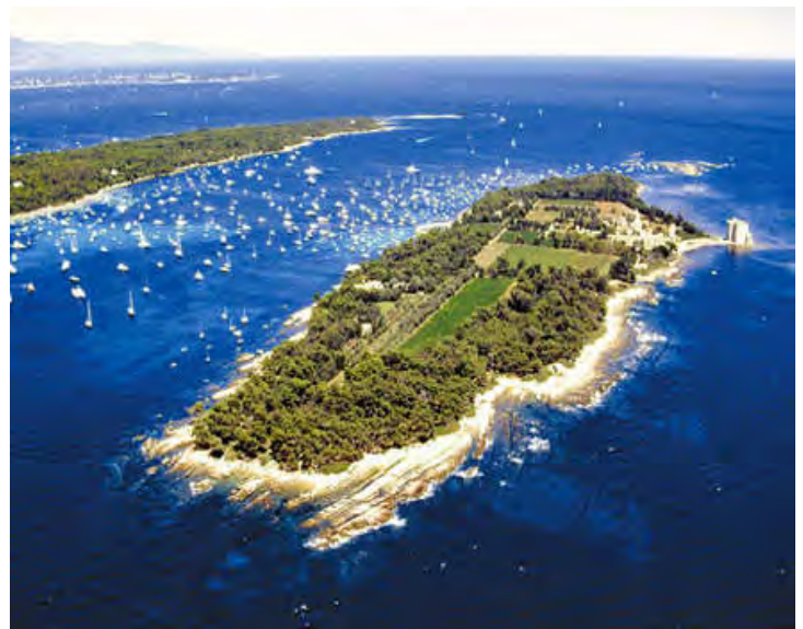
Sopra: L'isola di Sant'Onorato vista da SW; a sinistra, un lembo di Santa Margherita e, nello sfondo, la costa italiana fino a Bordighera Sotto: L'attuale monastero cistercense sull'isola di Sant'Onorato visto da S e l'antica fortezza

Si estendono a breve distanza dalla costa (Santa Margherita è a poco più di un km dalla punta della Croisette), al largo di Cannes, e si presentano di forma piatta (massima elevazione m 28) e abbastanza regolare.