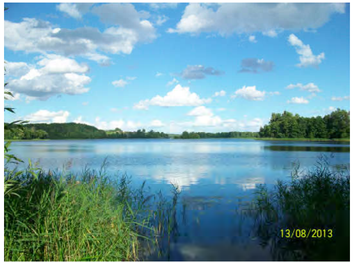
Il lago Lusiai a Maironys, nella regione delle Terre Alte

stinguono, ma soprattutto con gli angoli più remoti e meno 'sponsorizzati'. Appena fuori dalle città (non troppe peraltro) si può respirare un'atmosfera che ci porta indietro nel tempo. In Lituania la campagna, che occupa circa il 40% della superficie e dove sonnecchiano i fantasmi delle centinaia di fattorie collettive dei tempi dell'URSS, non parrebbe subire l'agricoltura intensiva come in altre parti dell'Europa. Nei moltissimi villaggi sparsi, dove i 'cittadini' amano ritornare nel week-end, la vita scorre semplice e genuina: quasi ogni famiglia ha i propri animali da cortile, il proprio appezzamento, le proprie mucche da mungere, rigorosamente incatenate al terreno, ed attinge ancora dal pozzo acqua freschissima.