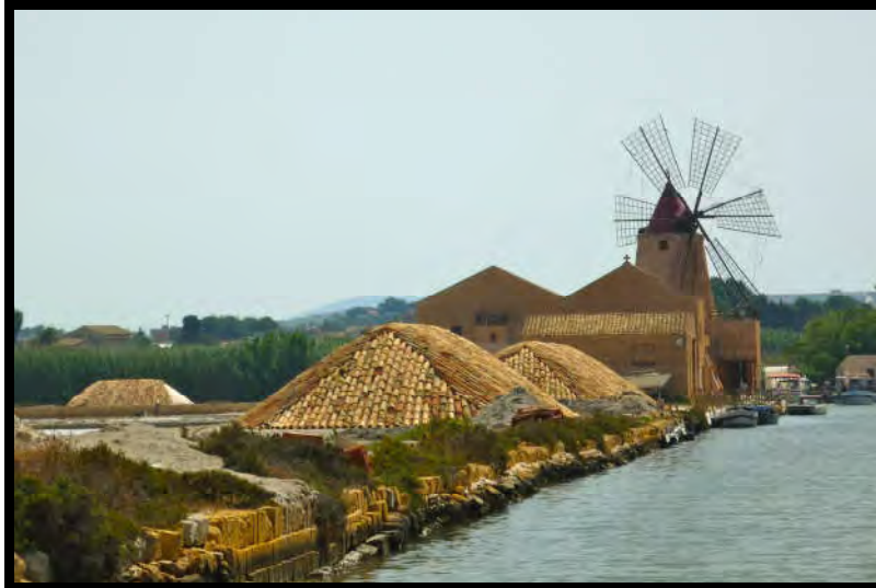
Suggestive immagini di saline del Trapanese. Nella foto in alto i cumuli di sale sono parzialmente protetti dalla pioggia mediante embrici.