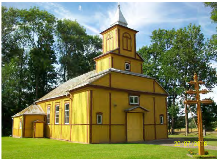
Alksnenai (Lituania centrale), chiesa di legno risalente al 1925

Durante i miei 10 anni di girovagare in lungo e in largo per il Paese alla ricerca di laghi e fiumi, ho voluto prendere contatto non solo con i 'fiori all'occhiello' che più lo contraddi-