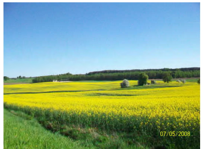
Campi di colza vicino a Prenai (Lituania centrale)

stinguono, ma soprattutto con gli angoli più remoti e meno 'sponsorizzati'. Appena fuori dalle città (non troppe peraltro) si può respirare un'atmosfera che ci porta indietro nel tempo. In Lituania la campagna, che occupa circa il 40% della superficie e dove sonnecchiano i fantasmi delle centinaia di fattorie collettive dei tempi dell'URSS, non parrebbe subire l'agricoltura intensiva come in altre parti dell'Europa. Nei moltissimi villaggi sparsi, dove i 'cittadini' amano ritornare nel week-end, la vita scorre semplice e genuina: quasi ogni famiglia ha i propri animali da cortile, il proprio appezzamento, le proprie mucche da mungere, rigorosamente incatenate al terreno, ed attinge ancora dal pozzo acqua freschissima.