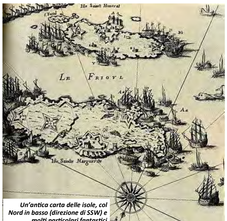
Un'antica carta delle isole, col Nord in basso (direzione di SSW) e molti particolari fantastici