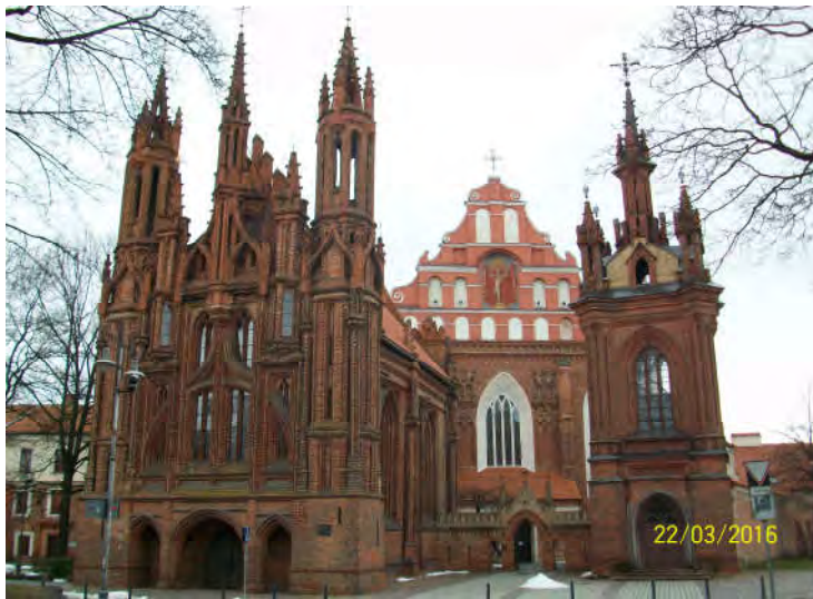
Vilnius, la chiesa gotica di Sant'Anna

Il nome Lituania, in lituano lietus ovvero 'pioggia', rispecchia in un certo senso quello che è il suo clima continentale temperato, con inverni rigidi ed estati tiepide e umide, soggetto a precipitazioni per circa 1/3 di giorni all'anno, mai troppo abbondanti a dir la verità e spesso nevose nelle stagioni fredde. Tale clima ha influenzato la copertura forestale, che occupa quasi il 25% del territorio, con conifere e betulle in bella evidenza, e che l'uomo ha saputo sfruttare intensa-