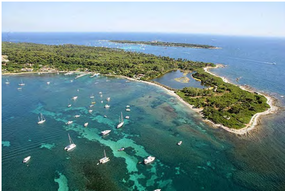
Foto aerea dell'isola di Santa Margherita, la principale delle isole di Lerino, al largo di Cannes, una meta vicina e molto interessante per ... quando saremo "liberati"

quest'anno in cui ricorrono i 75 anni dagli avvenimenti avrebbe dovuto far pensare che i molti che hanno combattuto e si sono sacrificati per la libertà hanno consentito che essa fosse poi goduta da tutti, anche da coloro che erano dalla parte opposta della barricata, e che oggi sono tornati ad abbracciare almeno in parte (o comunque a non rinnegare) le folli idee liberticide che hanno insanguinato l'Europa per tanti decenni, e si dichiarano "post-fascisti", come se il prefisso "dopo" li liberasse