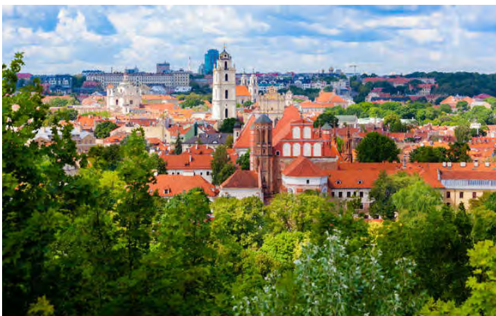
Un'immagine di Vilnius

Vi è poi la Lituania più gettonata dall'offerta turistica. Quella della capitale Vilnius, nell'est del paese, chiamata la "Gerusalemme del nord" per le 105 sinagoghe di un tempo e per la foltissima comunità ebraica sterminata durante la Seconda Guerra Mondiale. Ricordato che essa possiede 4 volte il verde di Parigi, si può aggiungere che è considerata da molti la più grande città barocca a nord delle Alpi e che il suo centro storico è tra i più interessanti dell'Europa centrale e orientale, ospitando quasi tutti gli stili architettonici europei, dal gotico sino al neoclassico.